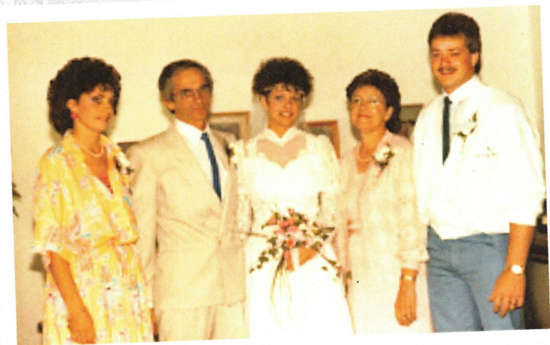
Mariage d'une de leur fille