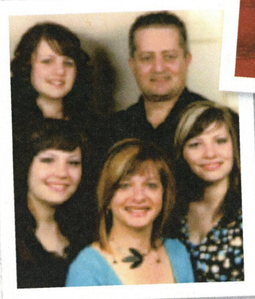
Leurs enfants avec leurs familles