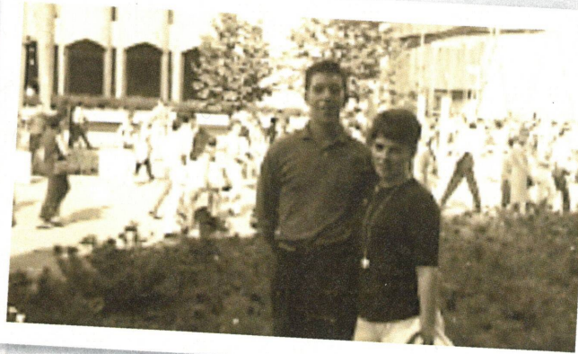
Voyage de noce