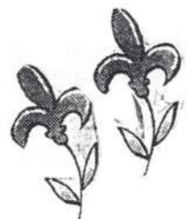
Gérard Villeneuve Maire

Au nom du conseil municipal, je souhaite à toute la population une saison estivale des plus agréable.