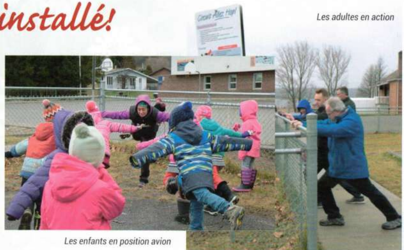
Les adultes en action

La boucle de deux (2) kilomètres part de la cour d'école, passe par le belvédère du marais et se continue sur la piste cyclable. Elle est animée de quatre (4) panneaux qui proposent des activités pour les adultes et pour les enfants. N'hésitez pas à aller faire le circuit avec vos enfants et vos petits-enfants, à pieds ou en raquette, à votre rythme. Allez vous amuser dehors!