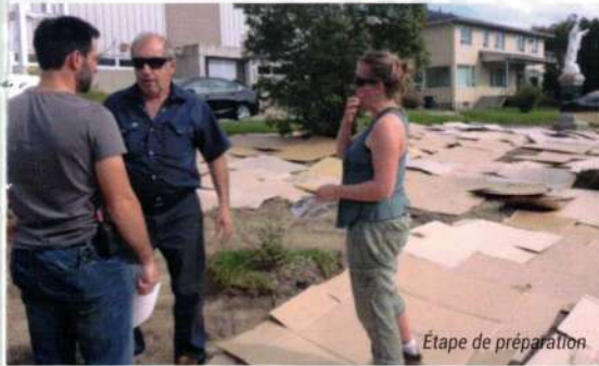
Étape de préparation

La population pourra, dès l'été prochain, récolter et déguster les fruits, fleurs et fines herbes issus de cette plantation. Ce projet d'agriculture urbaine permet de mettre de l'avant le jardinage écologique et les saines habitudes de vies!