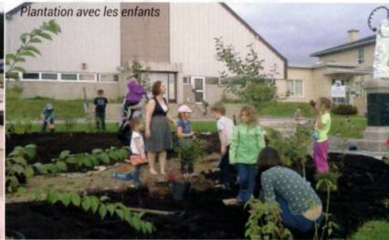
Plantation avec les enfants