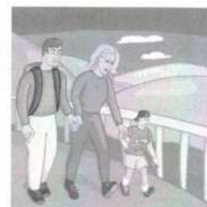
Le 11 octobre prochain, je participe à la Journée nationale du sport et de l'activité physique en famille.

Pour plus d'informations, veuillez contacter la Société de Développement au 674-1122.